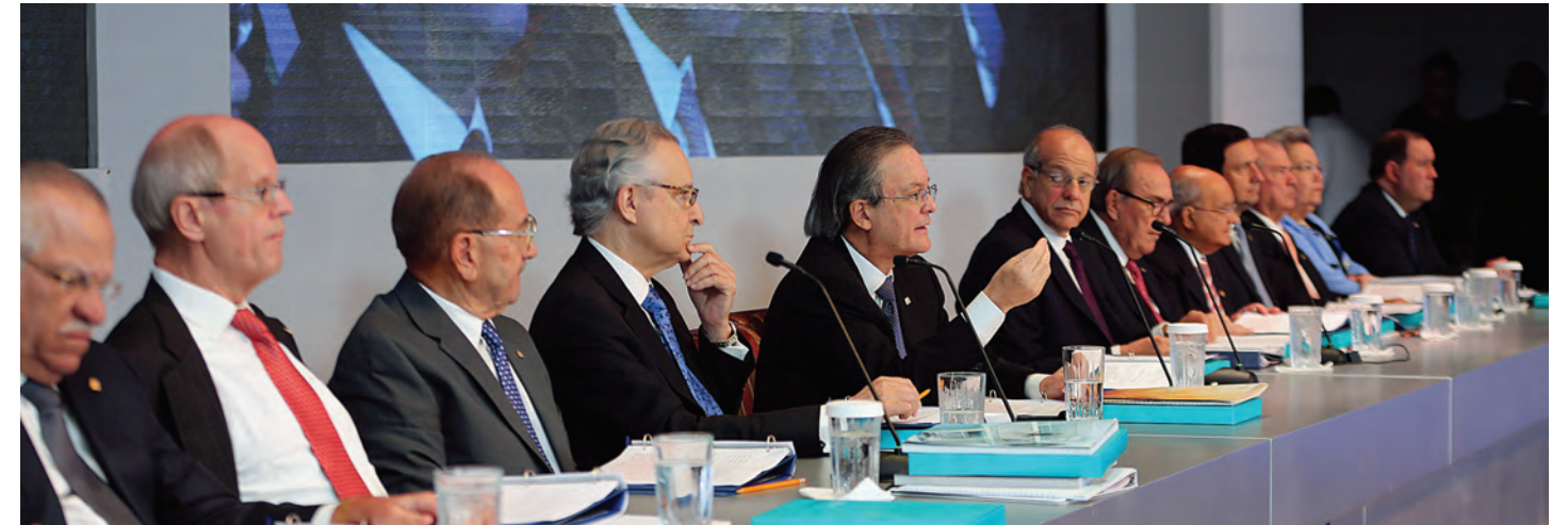
Los asambleístas de Grupo Popular conocieron y aprobaron el buen desempeño del Grupo Popular durante el ejercicio social del año 2013.

El Grupo Popular y su filial el Banco Popular Dominicano celebraron el pasado sábado 26 de abril, de manera conjunta, dos asambleas de accionistas, en las que se conoció, entre otros asuntos, el buen desempeño del Grupo Popular durante el ejercicio social del año 2013.