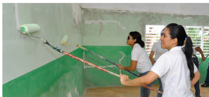
Empleados del Popular mientras realizan trabajos de pintura y acondicionamiento de una de las aulas del plantel.

El Programa de Reparación de Escuelas Rurales impacta positivamente en más de 5,000