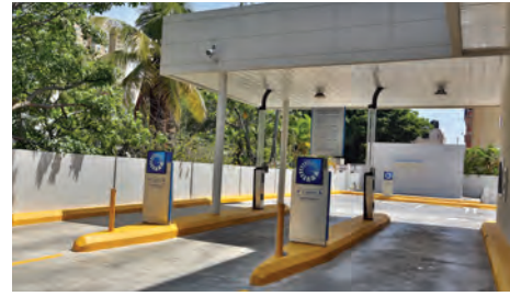
◀ FACHADA FRONTAL DE LA OFICINA BELLAS ARTES UBICADA EN LA AVENIDA MÁXIMO GÓMEZ, NÚMERO 12, ESQUINA CALLE BENIGNO FILOMENO DE ROJAS, SANTO DOMINGO, D. N.