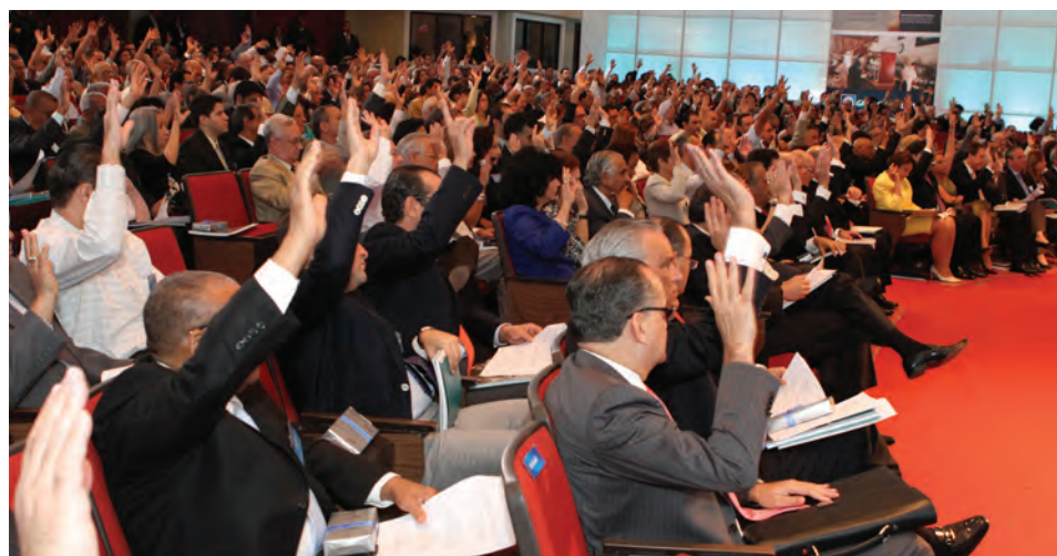
ACCIONISTAS EN LA ASAMBLEA GENERAL ORDINARIA ANUAL DEL GRUPO POPULAR, DONDE FUERON INFORMADOS DEL DESEMPEÑO LOGRADO EN 2011 POR LAS FILIALES LOCALES E INTERNACIONALES QUE LO CONFORMAN.

Es importante informarles, que al cierre del mes de junio de 2012, y de acuerdo con la Tercera Resolución aprobada por la Asamblea General Ordinaria Anual de Accionistas, celebrada en fecha 28 de abril de 2012, que declaró el pago de dividendos en acciones o en efectivo por la suma de RD$4,297.4 millones, han sido suscritas y